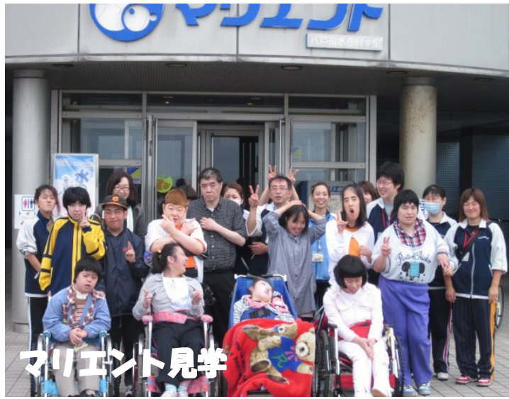
クライアント見学